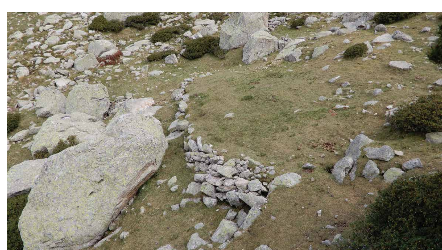
Carbonera de Setut, Vall del Madriu-Perafita-Claror