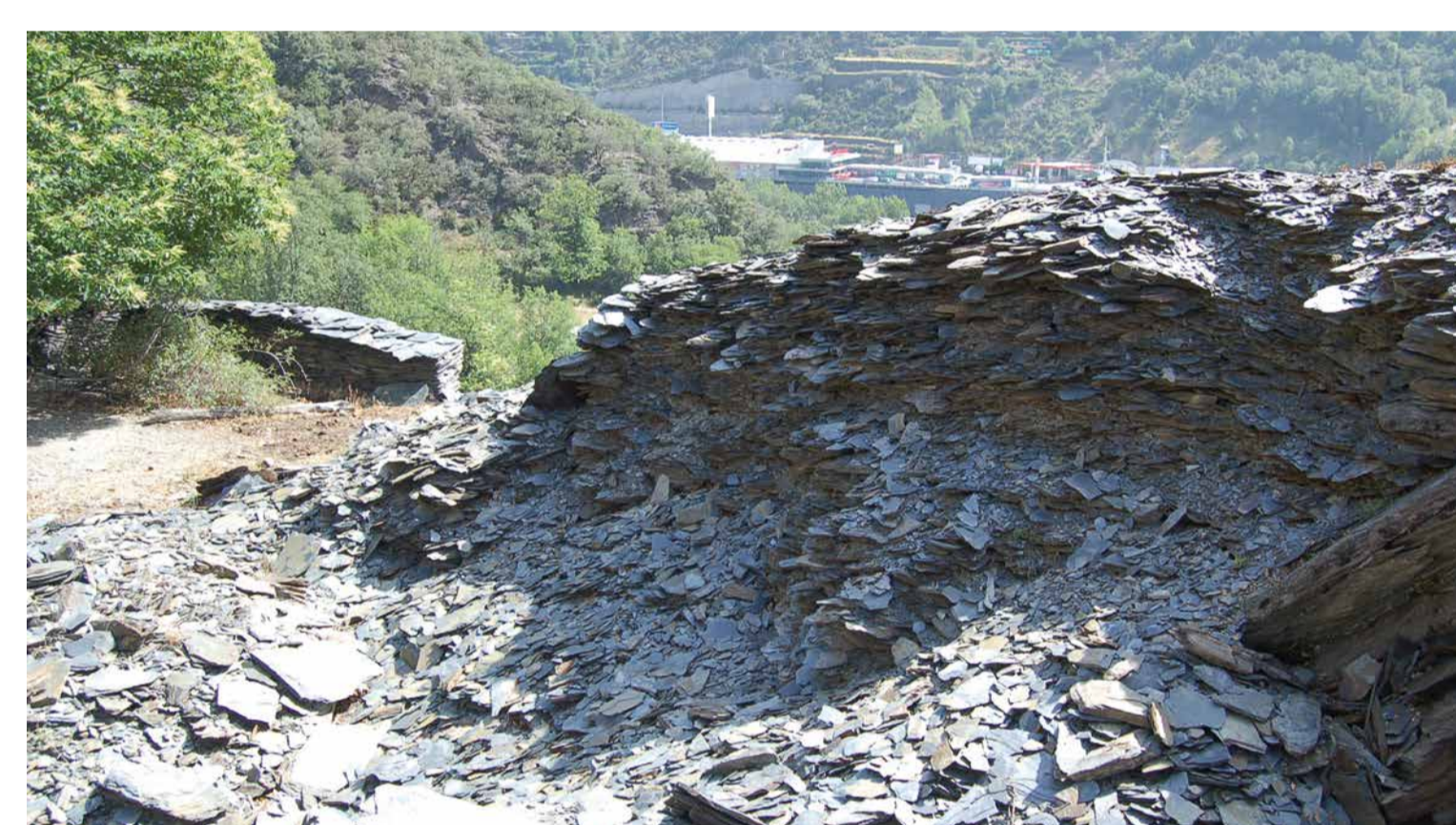
Lloser de Tolse, Sant Julià de Lòria