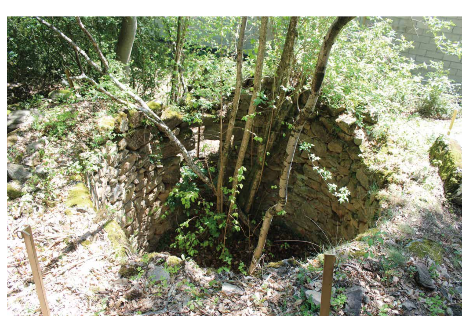
Forn de calç de la Margineda, Andorra la Vella