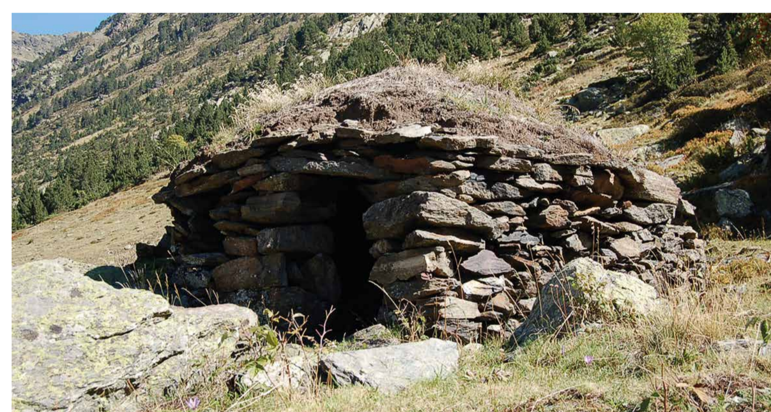
Cabana de la pleta de la Rabassa, Sant Julià de Lòria

L' orri és una estructura destinada a munyir els ramats ovins durant la seva estada a l'alta muntanya; amb la llet obtinguda s'elaborava formatge. L'orri sol estar acompanyat de cabanes i alguna pleta.