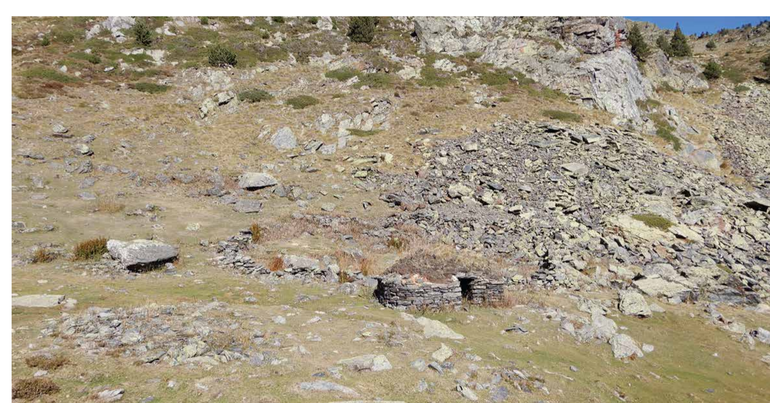
Pleta de l'Angonella, Ordino