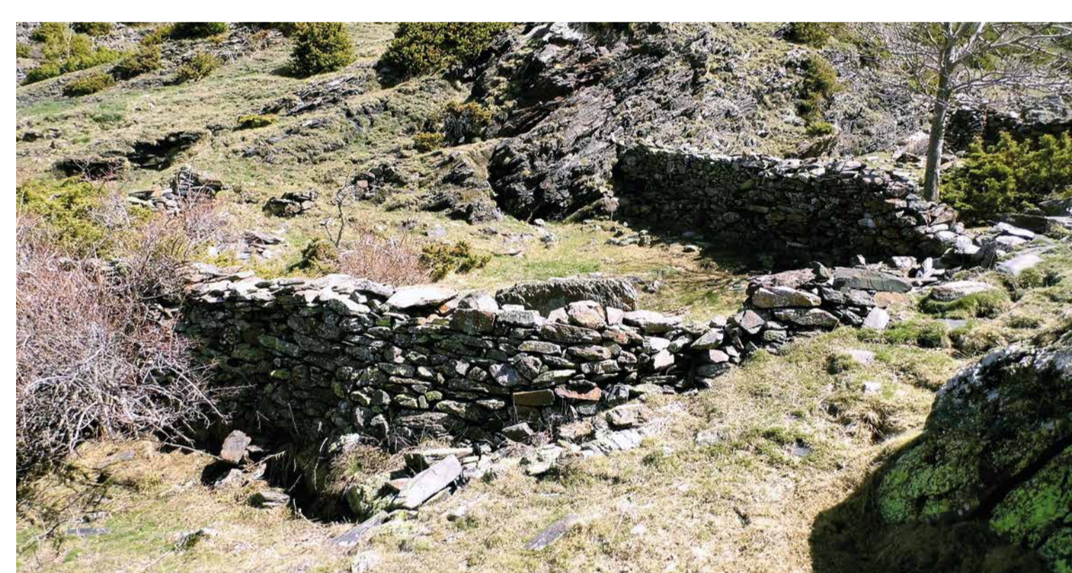
Corral de les Cabanes, Sant Julià de Lòria