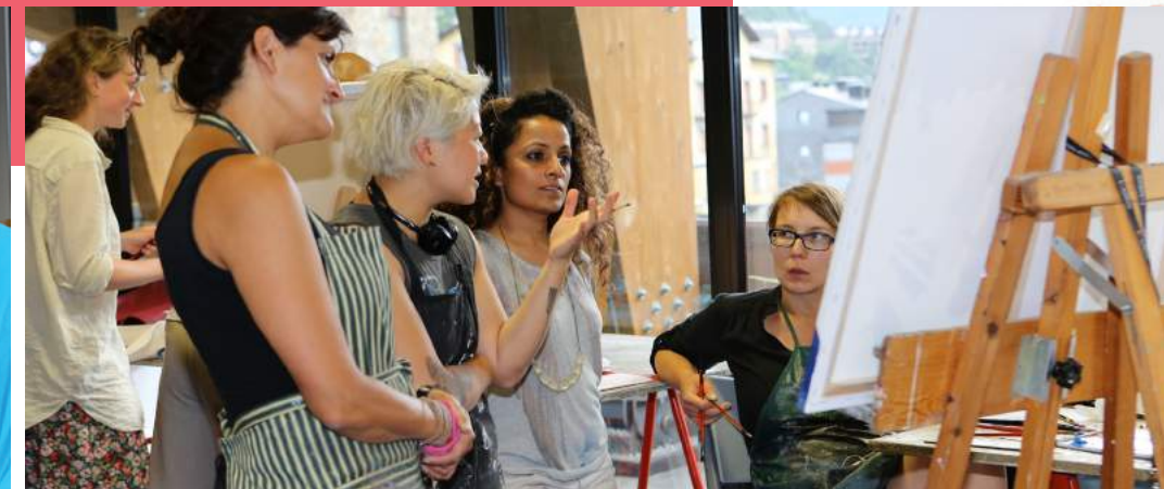
ARTISTES DE ART CAMP ANDORRA