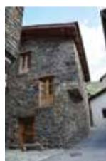
Casa Mariola a Sornàs