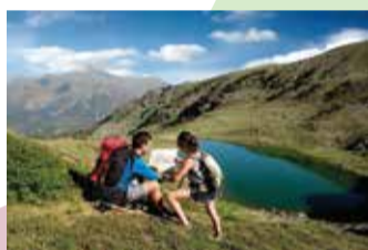
Vall de Sorteny.