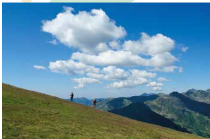
Senderisme a Ordino.

El desenvolupament sostenible és aquell que respon a les necessitats del present sense comprometre la possibilitat de respondre a les necessitats de les generacions futures.