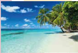
Illa Saona, República Dominicana

El turisme de sol i platja és sensible i dependent del temps meteorològic i del clima. El canvi climàtic alterarà les condicions meteorològiques i els recursos naturals de moltes destinacions turístiques. Per exemple, l'increment de temperatures previst afectarà el confort a les destinacions d'estiu com les zones costaneres actuals i provocarà onades de calor cada cop més freqüents i més intenses. L'increment del nivell del mar degut al canvi climàtic afectarà una gran quantitat de zones costaneres i illes, com les del Pacífic i el Carib, on el turisme té un pes molt important.