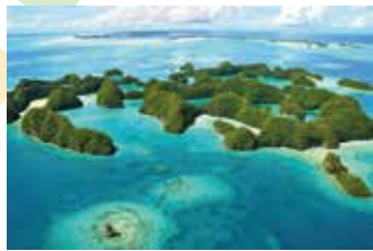
70 illes, República de Palau (Micronèsia)