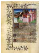
Marco Polo a la Xina Livre des Merveilles du Monde [1410-1412] Manuscrit Bibliothèque Nationale, Paris

Segles més tard va arribar l'època romàntica i les grans expedicions lligades a l'impuls de la ciència. De la mà del colonialisme, naturalistes, geògrafs, astrònoms, etc., acompanyaven els grans viatgers a la recerca de noves terres i recursos. Els orígens del turisme de natura els trobem també en el despertar romàntic de l'excursionisme i el muntanyisme i, així mateix, en els inicis de l'esquí, en espais naturals que ens són propers com els Pirineus o els Alps.