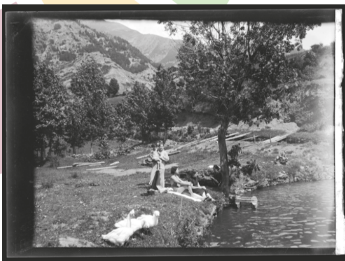
8_ACAP_1935 Familiars i amics de la casa Areny-Plandolit banyant-se a la bassa de la Farga [1930-1940]