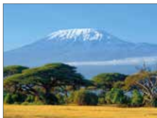
El Kilimanjaro a Tanzània