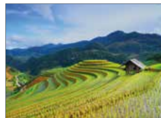
Camps d'arròs en terrasses al Vietnam