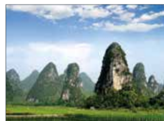
Paisatge de Guilin a la Xina