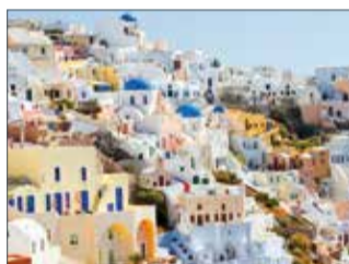
Vistes del poble d'Oia a l'illa de Santorini