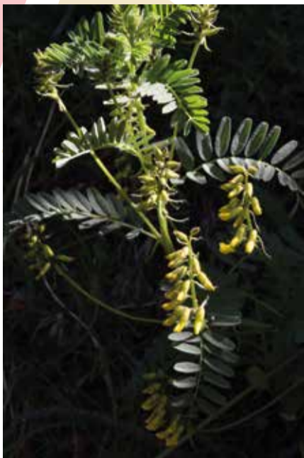
L' Astragalus penduliflorus és una de les espècies de les quals es fa el seguiment.

En els espais naturals també s'estudien des d'un punt de vista científic alguns grups de flora i fauna. Per exemple, la participació en el projecte de la xarxa FloraCat permet fer el seguiment de determinades espècies singulars en l'àmbit del Pirineu oriental.