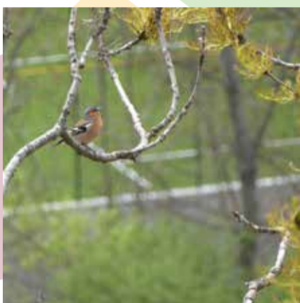
Pinsà comú ( Fringilla coelebs ).

El parc natural comunal de les Valls del Comapedrosa i el parc natural de la Vall de Sorteny col·laboren en el projecte del Seguiment d'ocells comuns d'Andorra (SOCA), coordinat pel CENMA. Gràcies al recull de dades s'obté informació estandarditzada de l'estat de conservació de les poblacions dels ocells comuns d'Andorra.