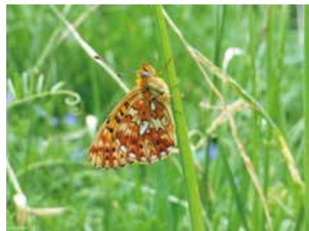
Donzella rogenca ( Boloria euphrosyne ).

Els tres espais naturals protegits formen part del projecte Butterfly Monitoring Scheme d'Andorra. És la xarxa de seguiment de ropalòcers (papallones diürnes) d'Andorra creada l'any 2004 i coordinada pel CENMA (Centre d'Estudis de la Neu i de la Muntanya d'Andorra).