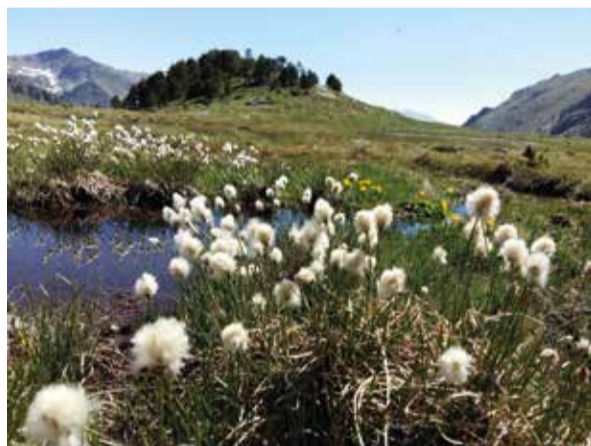
Bassa de les Granotes (Comapedrosa).

Les zones humides dels espais naturals formen part de la Llista internacional de zones humides del Conveni de Ramsar (el tractat internacional per a la conservació i l'ús sostenible de les zones humides del qual Andorra forma part des del 2012).