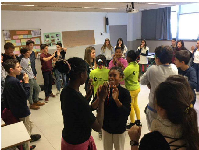
Alumnes de 2n curs amb el cor de Madagascar

2. Projecte d'intercanvi cultural amb les nenes de la Coral Malagasy Gospel, de Madagascar, a través a l'ONG Agua de Coco. Els alumnes de tots els cursos han pogut compartir moments amb les nostres visitants, a través de tallers de ball, llengua i d'altres. Els representants d'aquesta organització han explicat el projecte als nostres alumnes. Els alumnes de la coral de l'escola van anar a dormir a Naturlàndia i van cantar amb aquestes noies dos cançons al concert de l'Auditori Nacional.