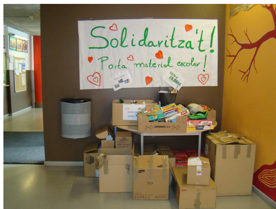
Recollida de material escolar per als refugiats sirians a Grècia

Quinze dies abans de la Jornada es va posar un punt de recollida de jocs, llibres i material escolar per als refugiats sirians de Grècia, que dos exalumnes de l'escola tornaven a visitar al cap de poc temps.