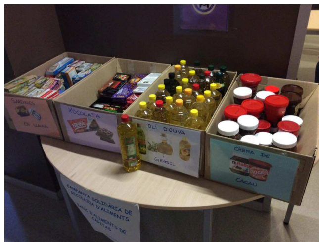
Recollida d'oli d'oliva, crema de xocolata, xocolata i sardines de llauna