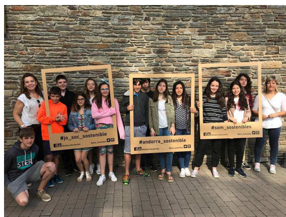
Representants del centre al Fòrum de les escoles verdes

El divendres 9 de juny vam celebrar el VI Fòrum de les escoles verdes a Canillo. Els representants d'escola verda de totes les escoles verdes d'Andorra es van reunir al Palau de Gel de Canillo, per presentar les activitats i accions que es fan en cada una. Entremig de les presentacions, es va celebrar un esmorzar sostenible a l'exterior del centre. En finalitzar, es van repartir els adhesius de renovació i les plaques a les noves escoles verdes.