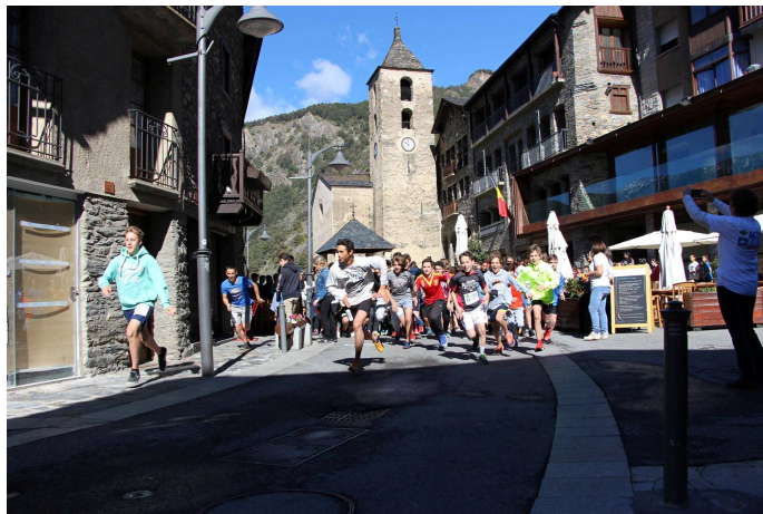
Cursa contra la fam pels carrers d'Ordino

“Cursa contra la fam”. La Cursa contra la fam sensibilitza milers d'alumnes de tot el món sobre el problema de la fam i de la desnutrició, mobilitzant-los per lluitar contra aquesta realitat mitjançant una cursa solidària. Aquest acte permet que els nostres joves s'impliquin en una acció que servirà per ajudar les poblacions més desfavorides demostrant que cadascú de nosaltres pot actuar i comprometre's en la lluita contra la fam independentment de quina sigui la nostra edat o condició. Enguany la Cursa ha anat destinada a recaptar diners per Etiòpia. Aquesta cursa es fa conjuntament amb els alumnes de l'EA de 1a ensenyança d'Ordino.