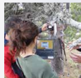
Una expedició de l'EWI revisant caixes niu durant el seguiment d'ocells. Lectura dels dendròmetres digitals.