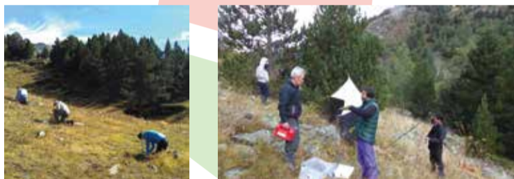
Expedicions de l'EWI a Andorra. Recollida de mostres per analitzar la descomposició del sòl i preparant una trampa malàsia per capturar artròpodes.

És una ONG dedicada a la conservació a través de projectes de participació ciutadana. Els seus objectius són: coordinar voluntaris per prendre part en projectes d'investigació científica, educació mediambiental i formació.