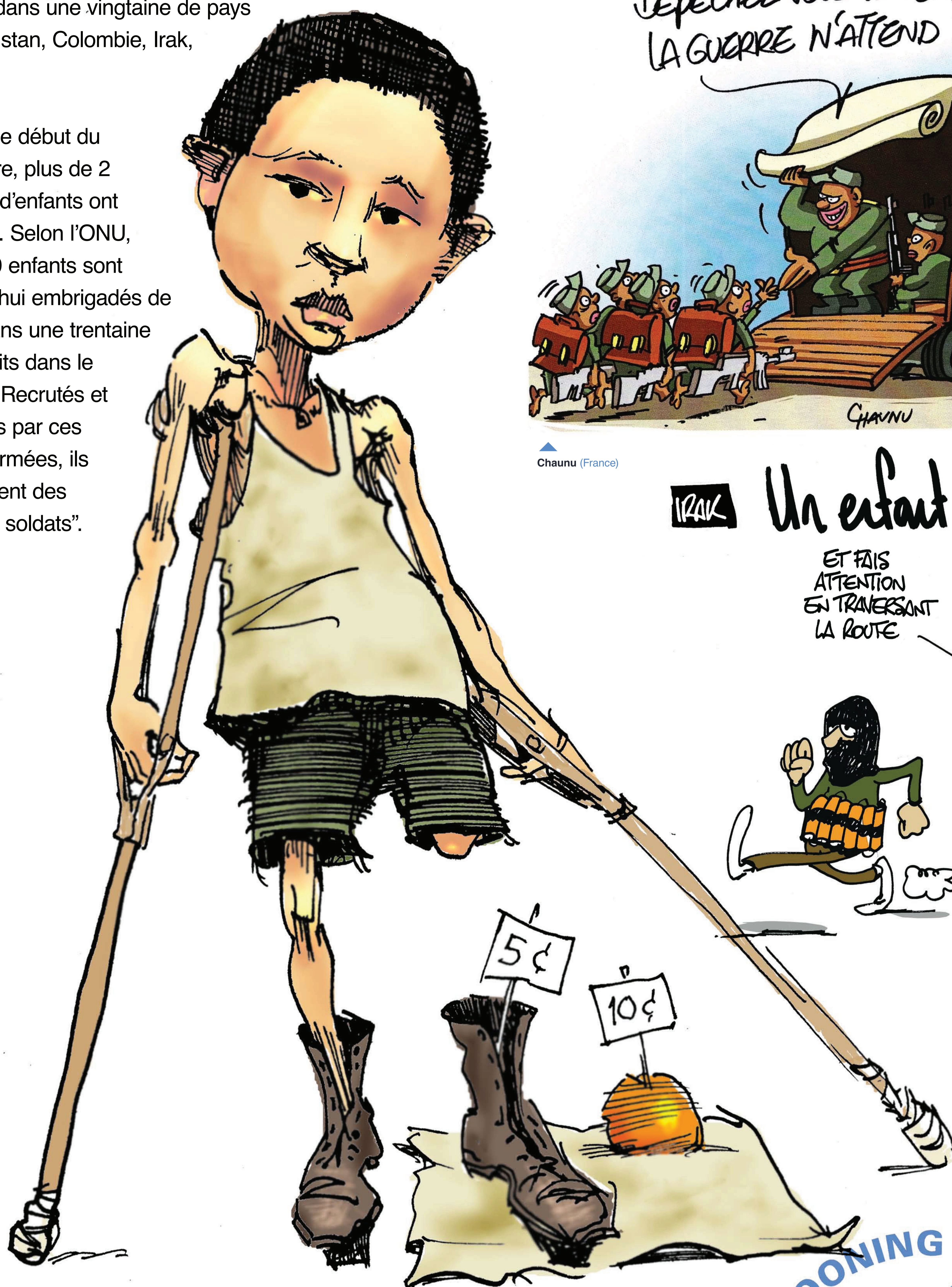
▶ Riber (Suède)