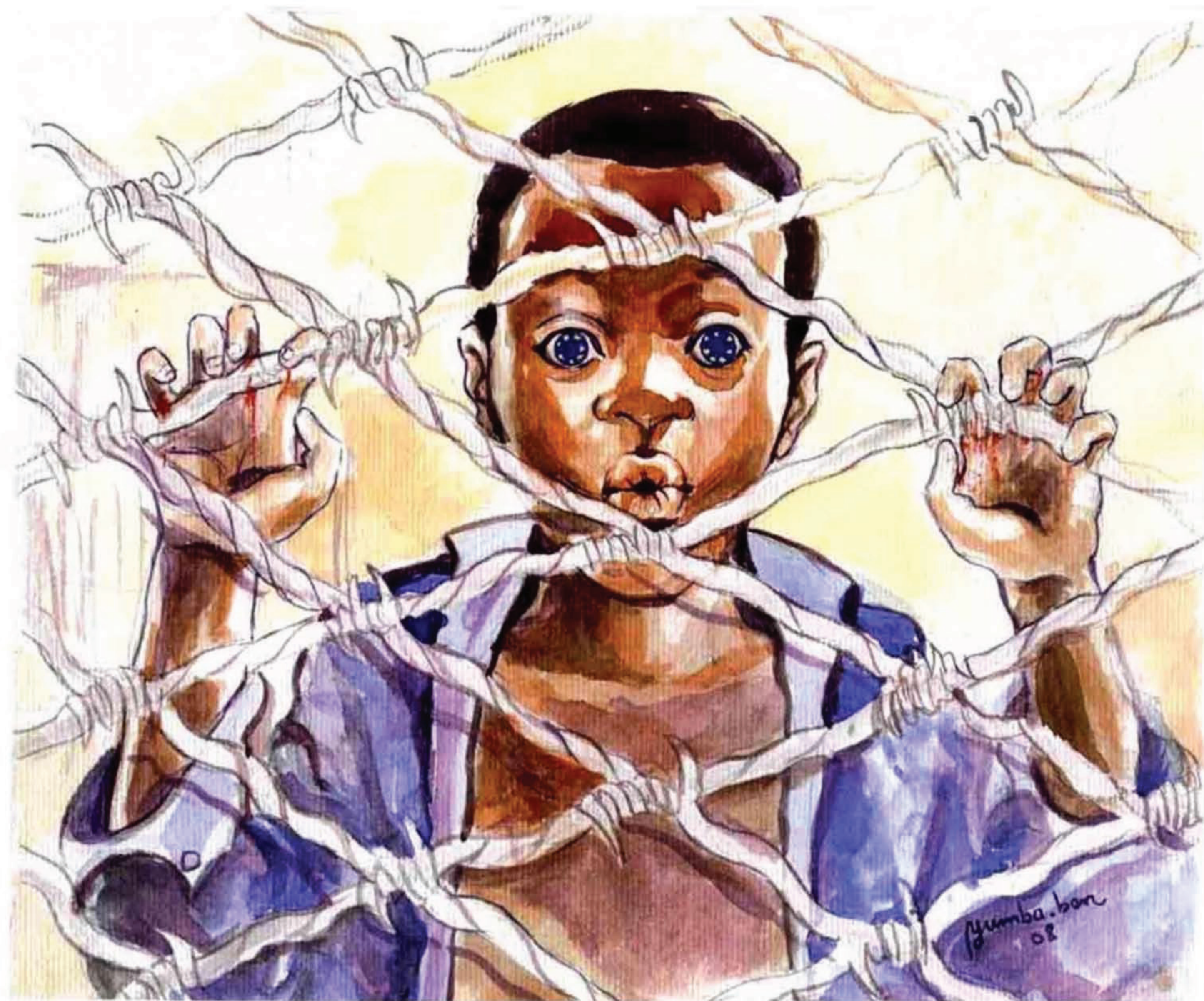
«RÊVE D'EUROPE» Yumba (Congo) ▶

Leur jeune âge ne les protège pas de la guerre. Chaque jour, des milliers de civils sont tués ou blessés dans des conflits armés. La moitié de ces victimes sont des enfants.