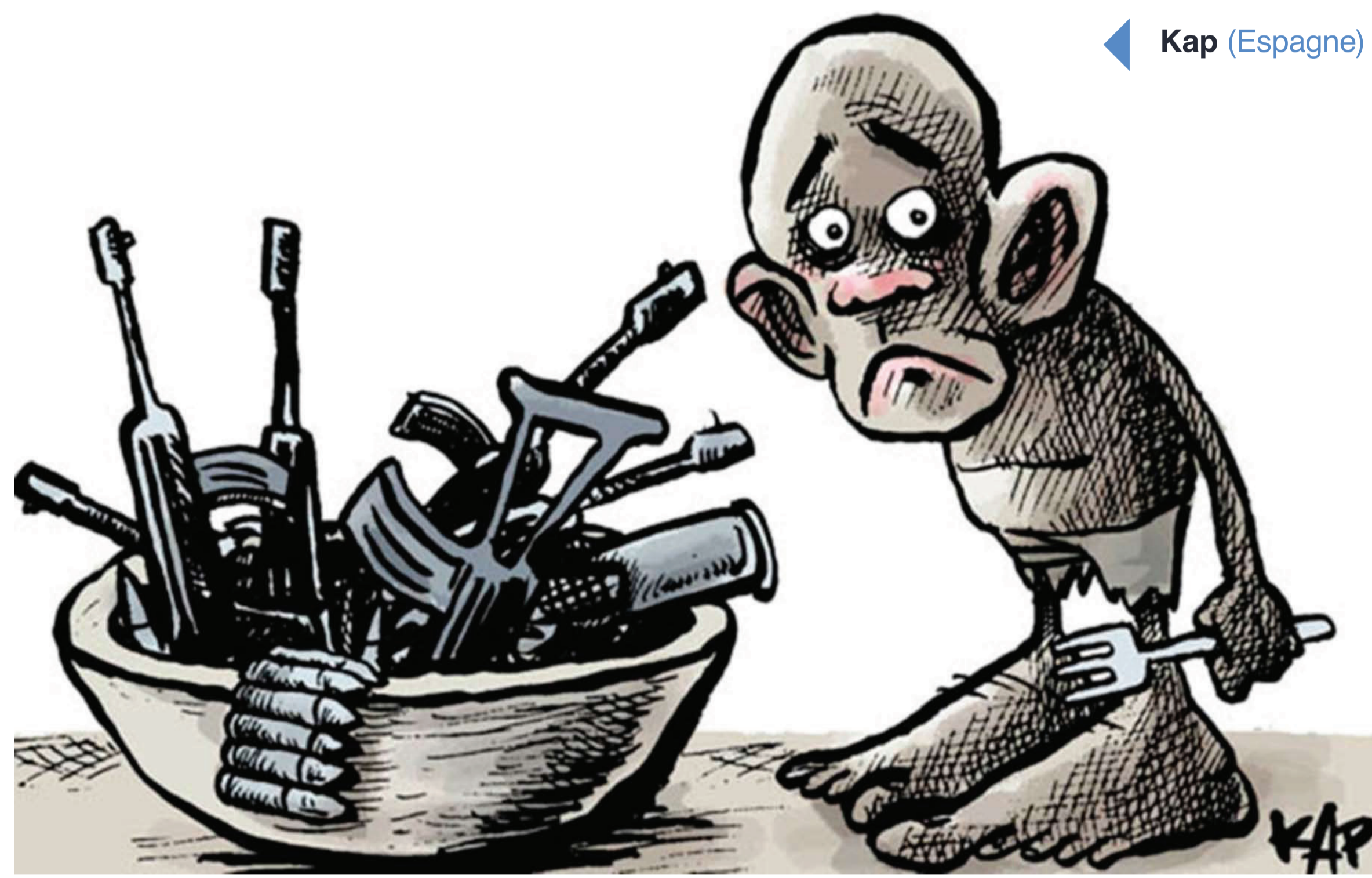
◀ Kap (Espagne)

« Une partie de notre vie a été volée. Nous ne la retrouverons jamais. »