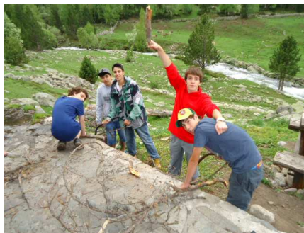
Els alumnes a Fontverd