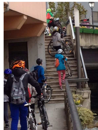
Sortida al museu de l'aigua

Relacionat amb el tema de centre, la sostenibilitat, s'han realitzat sortides al país. Els alumnes es van desplaçar en bicicleta per tal de conscienciar els alumnes de l'ús d'un transport ecològic) fins al museu de l'aigua.